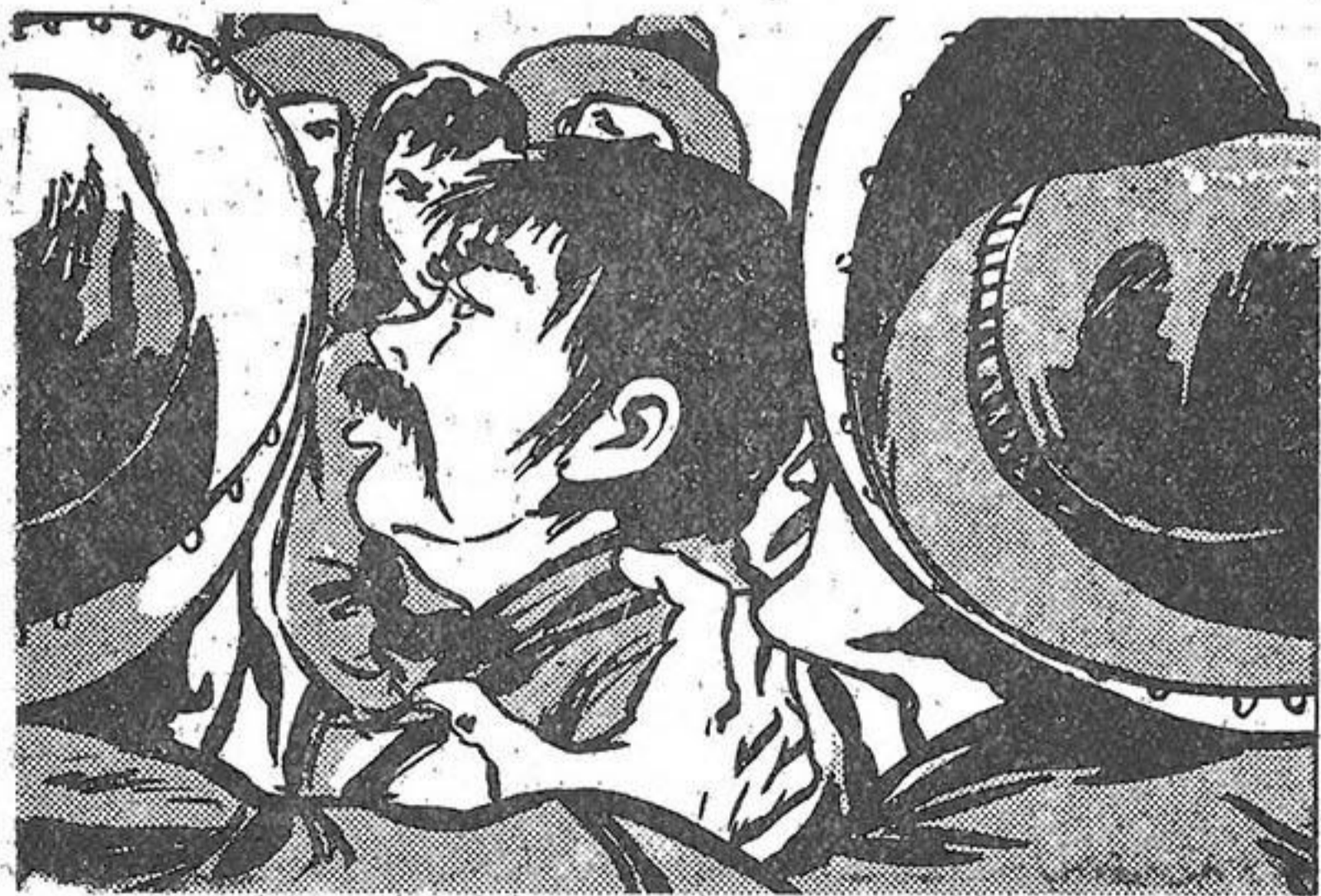
Δέκα άνθρωποι πέφτουν επάνω τους.

Ο Ζορρό για δεύτερη φορά γλιστράει πάνω στο τεντωμένο του μαστίγιο, μ' όση γρηγοράδα μπορεί. Είναι τυχερός που φοράει τα πέτσινα γάντια του, αλλιώς και τις δυο φορές θα είχαν καή