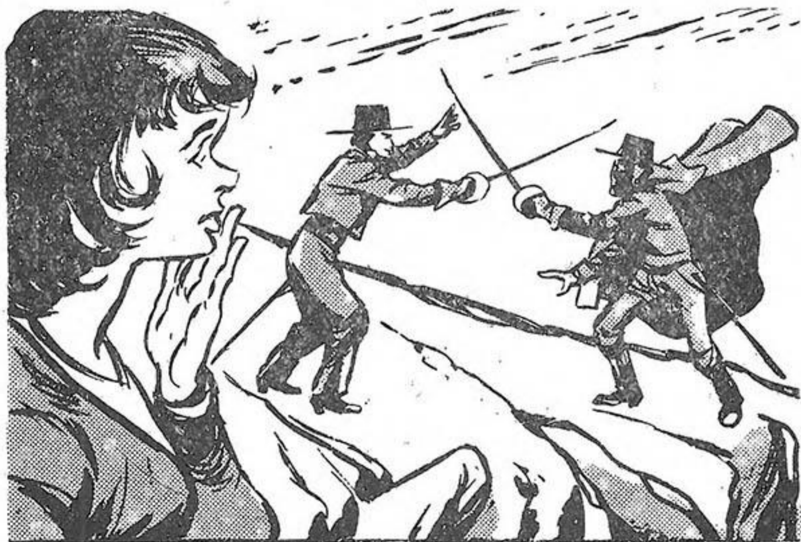
Πηδώντας ἀπὸ βράχο σὲ βράχο, οἱ δυὸ ἀντίπαλοι...

Στὶς γύρω σπηλιές οἱ φωτὲς ἔχουν σβύσει. Βαρειὰ ροχαλητὰ ἀκούγονται μόνο, τόσο δυνατὰ, πού κάνουν καὶ τὰ Γαλέρα νὰ φέρνῃ κάθισε τόσο τὴ χερσούκλα του στὸ στόμα καὶ νὰ χασμουρῆται! Ἰσχυρὸ πηγαίνε ἀκριβῶς στὸ σημεῖο πού τοῦ ἔδειξε ὁ κύριός του. Ἔχει καταλόβει