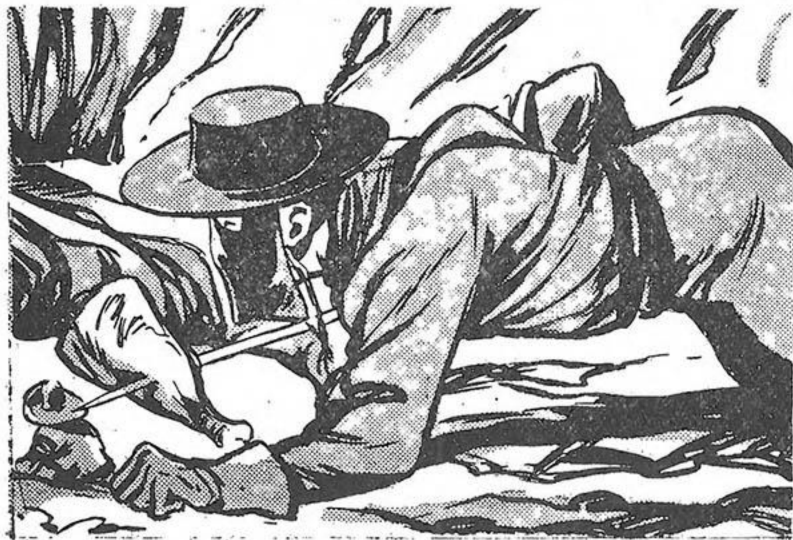
Τὸ καρφώνει γερά...

Ἀδιαφορεῖ τελείως γιὰ τὸν Δὸν Ἐστέμπαν που τόχει βιά