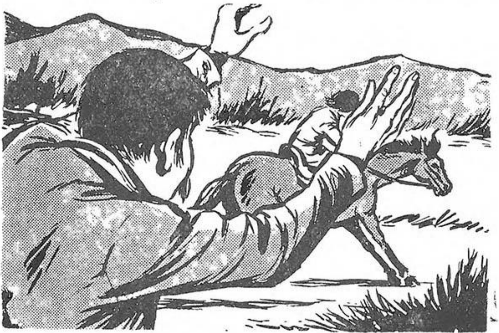
Τρέχει ἀναμαλλιασμένη πρὸς τὸ μέρος τους.

— Μά... σενόρ!, κάνει ἐκεῖνος μὲ γουρλωμένα μάτια.