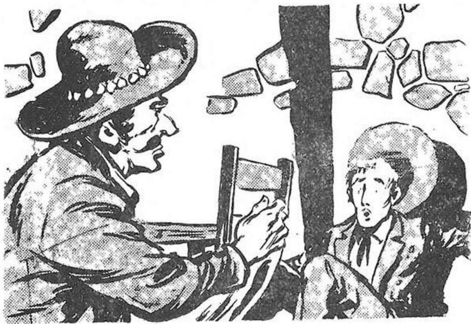
Στέλνει τὸν φτωχὸ ἄνθρωπο νὰ κυλήσῃ τὸν ἀπέναντι τοῖχο

Οἱ σύντροφοί του πλησιάζουν μὲ τὸ πάσο τους, γύρω ἀπὸ τὸ τραπέζι καὶ τότε οἱ ἄνθρωποι ποὺ κάθονται σ' αὐτὸ, σπεύδουν νὰ σηκωθοῦν