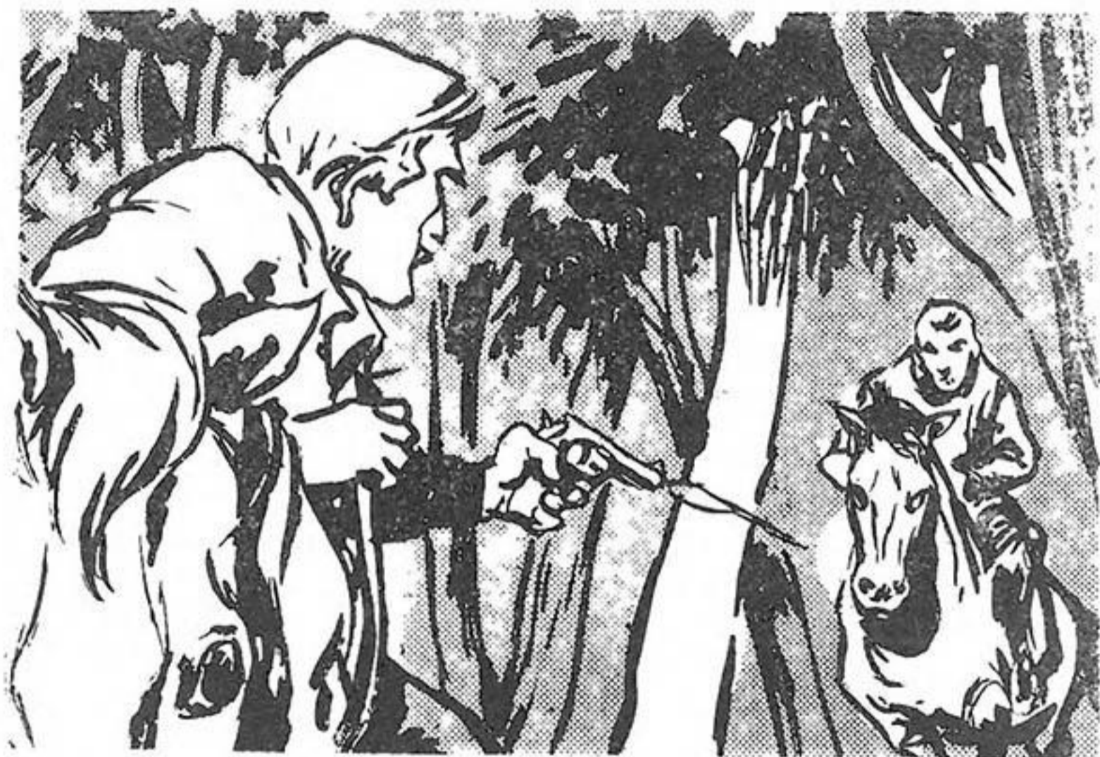
Στρέφει και πυροβολεί πρώτος στον "Έλληνα.

λάρης, οδηγεί τ' άλόγό του με ασύλληπτη ταχύτητα, ανάμεσα στους πυκνούς κορμούς. Κινδυνεύει κάθε στιγμή να σκοτωθῆ πέφτοντας επάνω σε κανένα δέντρο. Σάν άστραπή φεύγουν οί όλόϊσιες, μαύρες σκιές όλόγυρά του. Κάθε δευτερόλεπτο που περνάει τὸ φέρνει πιὸ κοντὰ στὸ φυγάδα, που δὲν τολμᾷ νὰ τρέξη τόσο γρήγορα μέσα στὸ πυκνὸ δάσος, μετὸ λίγο στὸ φῶς τοῦ φεγγαριοῦ.