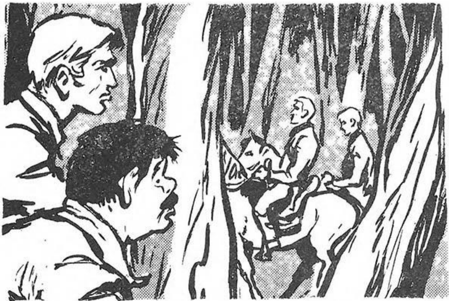
Ὁ Γαλέρας κι' ὁ Ἑλληνας βλέπουν νὰ βγαίνουν δυὸ ἄντρες.